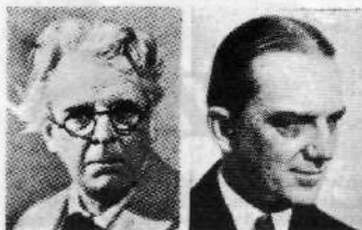
William Butler Yeats. Owen D. Young.

grænsen til Pennsylvania, USA; 168 000 indb. (1940). Jern- og stålindustri.