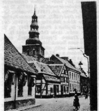
Gade i Ystad. I baggrunden Mariakyrkan.

Ystad [ˈyːsta(d)], sv. købstad, S-Skåne;