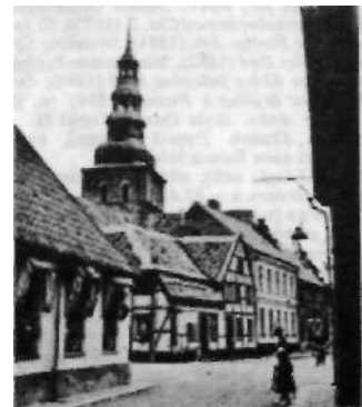
Gade i Ystad. I baggrunden Mariakyrkan.

Ystad [ˈy:sta(d)], sv. købstad, S-Skåne;