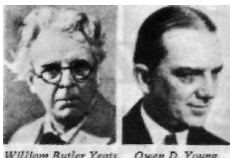
William Butler Yeats, Owen D. Young.

grænsen til Pennsylvania, USA; 168 000 indb. (1940). Jern- og stålindustri.